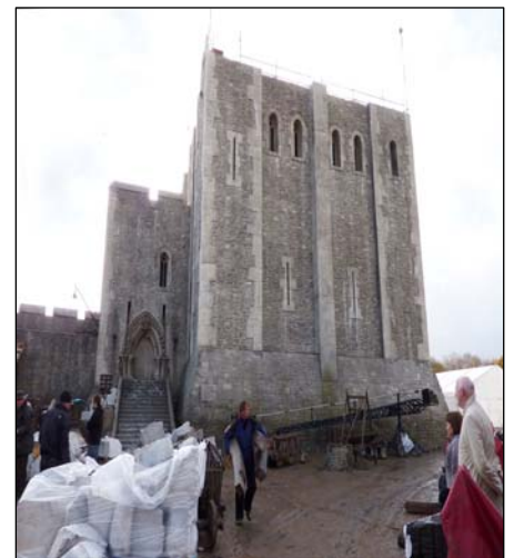
Cyflun o Gastell Rochester ag adeiladwyd ar safle Stiwdios Dragon ar gyfer y ffilm Ironclad .

Mae'r ffilm ganoloesol gyffrous hon sy'n llawn digwyddiadau wedi'i gosod yn 1215, ac mae'n ymwneud â gwarchae Castell Rochester. Mae'n cynnwys cast enwog, gan gynnwys Paul Giamatti a enwebwyd am Oscar, James Purefoy, Brian Cox, Mackenzie Crook, Jason Flemyng, Derek Jacobi a Kate Mara.